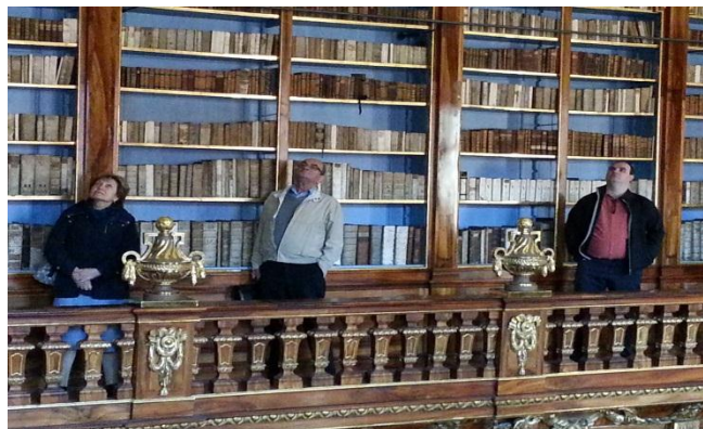
Historické sály Strahovské knihovny