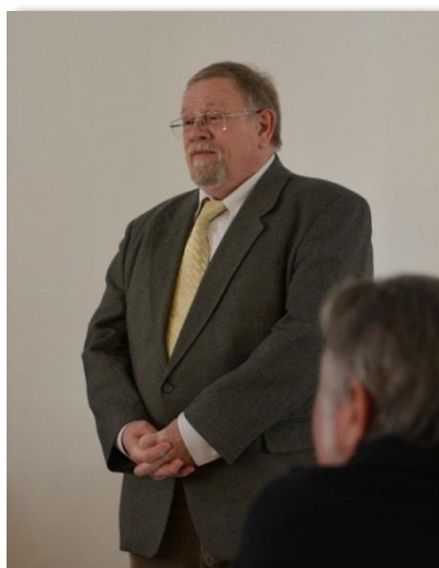
Mgr. Daniel Kroupa, Ph.D.

Dne 17. 4. 2014 v prostorách studovny Knihovny Antonína Švehly proběhlo slavnostní udílení Ceny Antonína Švehly. Oceněnými se staly osobnosti české politiky a vědy Pavel Bratinka a Daniel Kroupa .