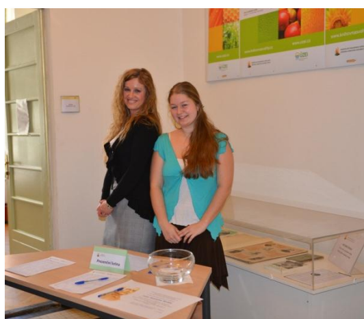
Kolektiv knihovny Antonína Švehly